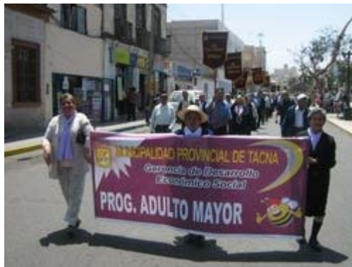
Tacna, Perú 2007