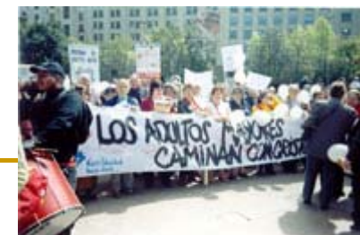
Chile Caminata por la Dignidad de las Cabezas Blancas 2005.