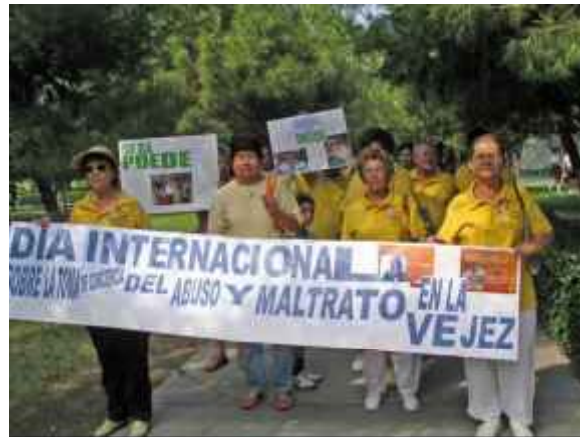
↑ México: PRODIA Ciudad de Juárez 2007