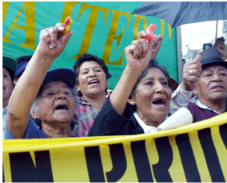
↑ Ecuador: Jubilados 2005